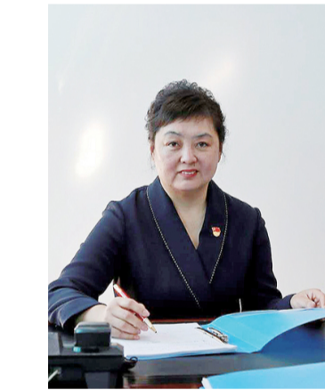
东丰县委书记郑一明。

凡事预则立,不预则废。抓好、抓实项目,首先要全力抓好项目策划谋划工作,做好项目编制工作,做到心中有数。提高谋划能力,要根据国家和省里对相关产业的支持方向,谋划实施一批打基础、利长远、惠民生的重大项目。抓好、抓实项目,关键要抓好重点项目。重点项目是高质量发展的“顶梁柱”,抓好重点项目事关大局和长远。我们要围绕重点工业建设项目和基础设施重点建设项目两个重点,抓好重点项目规划、落地和建设。抓好、抓实项目,要不断强化项目调度推进。效率就是生命,项目建设没有一拍、一误就可能错过发展良机。因此,我们一定要增强发展责任感,强化要素保障,加速项目推进、落地、见成效。