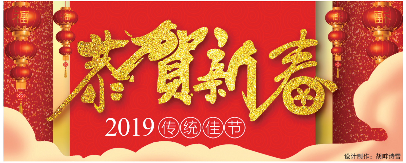
设计制作:胡畔诗雪