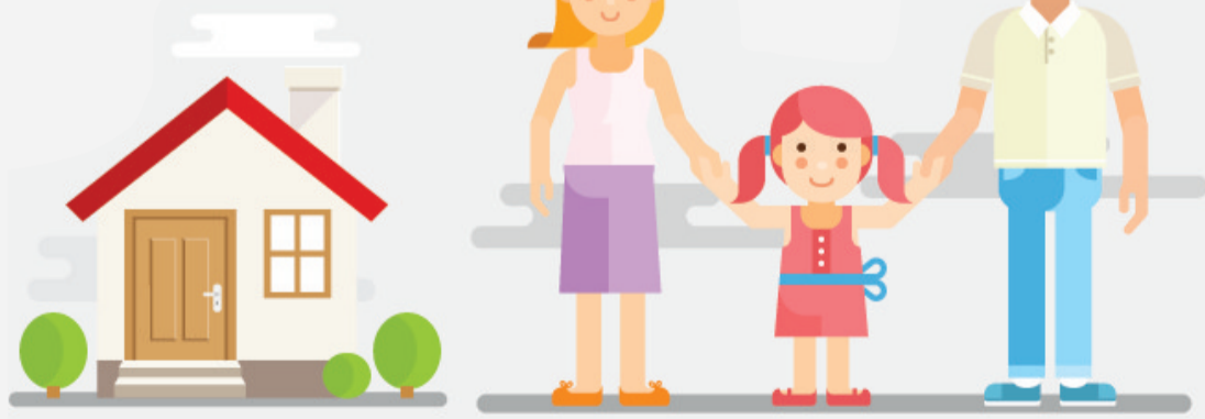
本版稿件由辽源市社会保险事业管理局提供

1993年,我市养老保险覆盖人数仅为77863人(含离退休人员14537人)。2011年启动新型农村社会养老保险和城镇居民养老保险试点工作,2017年开始经办机构事业单位养老保险准备期业务,养老保险制度覆盖范围不断扩大,截至目前,我市三项