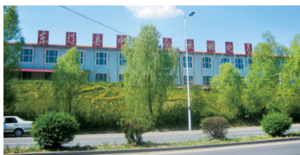
东辽县中小企业孵化基地

推进“创新”多样化。通过集聚要素,提供服务,分批组织众创空间建设单位赴北京、青岛等地考察和学习,探索和“创新”众创空间各种新型模式,形成了运行机制灵活、服务特色鲜明的各类众创空间。