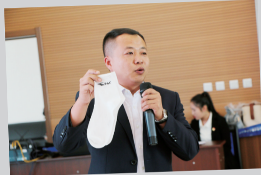
第三届青年创新创业大赛参赛者作品产品展示