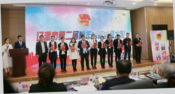
第二届青年创新创业大赛获奖者