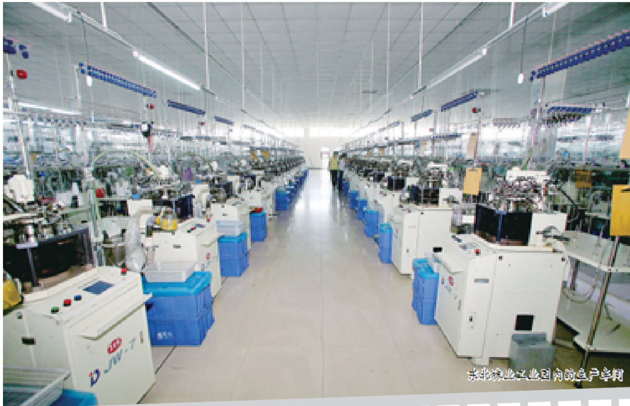
东北林业工业园的总生产棚