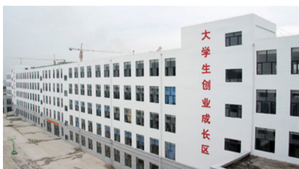
大学生创业成长区

开展有特色、创新性的服务工作。为了全面推进大学生创业企业的快速发展,园区对大学生实施全方面多角度的创业指导和“保姆式加一站式”服务。一方面为创业大学生免费提供厂房、林机等硬件条件,另一方面园区成立了大学生创业指导中心,进行跟踪服务。从设备选型到原材料采购,从产品开发到产品销售、从人员招录到技能培训、从资金使用到成本核算,实施全方面多角度的创业指导和“保姆式”及“一站式”服务,采取“一对一”的方式帮助带动大学生创业。此外,东北林业还构筑了人力资源、金融中介、物流仓储、生产研发、网络信息、营销策划、投资咨询、综合配套等八大服务平台,为大学生们提供高效优质的服务。