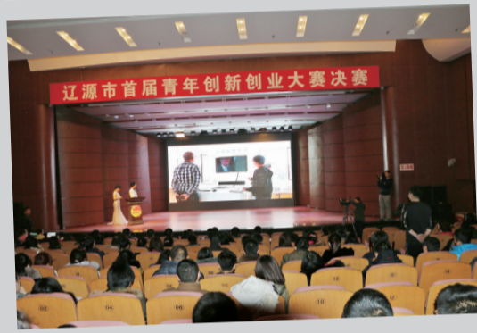
首届青年创新创业大赛决赛现场

创新是社会进步之魂,创业是就业富民之源,创业创新是实现经济发展和就业增长的核心动力。培育新动能、改造旧动能,在经济、科技高速发展的今天,新技术、新业态、新模式等取代传统经济发展模式是社会发展的必然趋势。“新旧动能”的概念从2015年提出,到2016年内涵丰富,再到2017年“新旧动能转换”具体工作推进。我国经济正处在“新旧动能转换”的艰难进程中,即经济社会进入了“新常态”,同时,已着手逐步推进经济“新旧动能转换”工作。一直以来,在市委、市政府的领导下,通过各部门的积极协调配合以及全市相关企业家的不懈努力,我市认真贯彻落实中央和省决策部署,依托载体、搭建平台、创优环境,使一批创新创业主体脱颖而出,互联网+、“智慧城市”、信息惠民试点等工作稳步推进,有力激发了全社会创新创业活力,促进了全市经济转型升级、稳中有进、稳中向好发展,形成了加强配套政策制定、强化重大项目带动、提供多元财政金融支持、强化产业政策引导的整体格局,加快了推进“新常态”背景下经济增长“双引擎”的步伐。