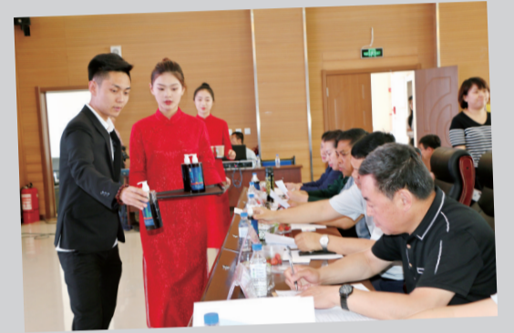
第四届青年创新创业大赛选手为嘉宾评委展示产品